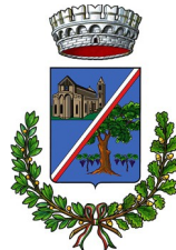
Comune di Dolianova

Regioni Autònoma de Sardigna - Lei 482/99 e L.R. 22/2018