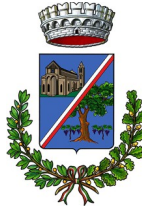
Comunu de Particella/Sici

Regioni Autònoma de Sardigna - Lei 482/99 e L.R. 22/2018