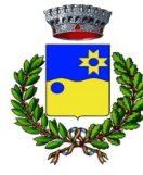
Comunu de Sètimu