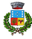
Comunu de Solèminis