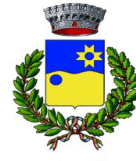
Comunu de Sètimu