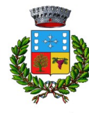
Comunu de Solèminis